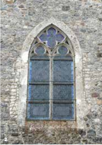
1. Façade de l'église paroissiale