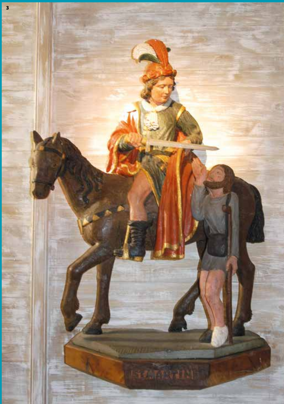
3. Saint Martin, bois polychrome, 17 e siècle